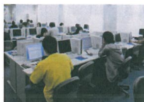
情報カフェテリア

2006年4月より利用の始まった校舎です。教室のほか、学生用の施設が充実しています。情報カフェテリアでは、パソコンの利用が可能です。