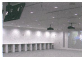
メディアラウンジ