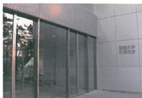
外濠校舎正面入口