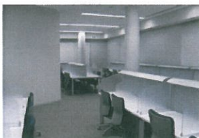
スタディールーム (自習室)