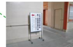
オプション案内板① (低層用エレベーター前)