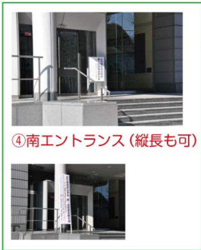
④南エントランス (縦長も可)