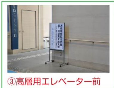
③高層用エレベーター前