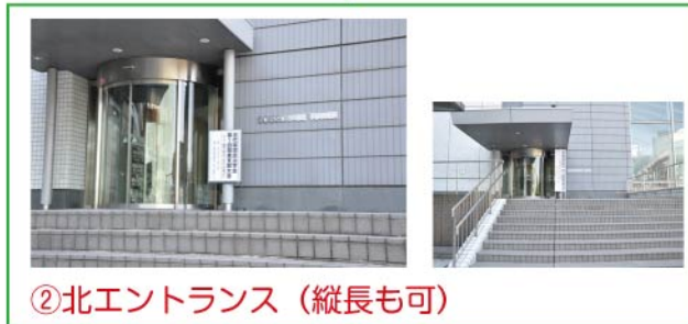
②北エントランス (縦長も可)